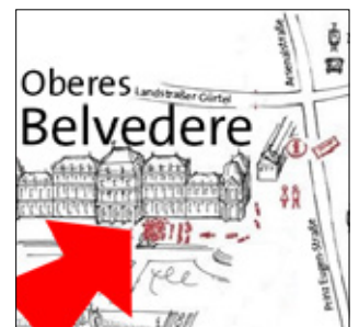
Treffpunkt beim Eingang des Oberen Belvedere